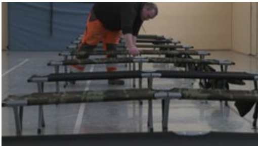
Feldbetten werden in der Turnhalle aufgestellt

Die Stadt Menden bereitet eine leerstehende Turnhalle vor, um dort - wenn nötig - Menschen unterzubringen, die sich nicht an die Coronavirus Quarantänevorschriften halten. Noch gebe es keinen akuten Fall, aber man wolle vorbereitet sein, sagt die Stadt.